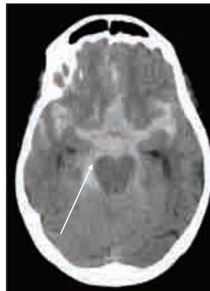
Obr. 4. Masivní subarachnoidální krvácení (šipka) u warfarinizované pacientky (INR 3,0). CT vyšetření 1 hod po příhodě.

jící rozmezí INR 2,5–3,5, u ostatních indikací je cílová hodnota INR v obvyklém rozmezí 2,0–3,0 [6]. Pokud jsou u těchto klinických jednotek současně přítomny i další rizikové faktory tromboembolizmu – fibrilace síní, hyperkoagulační stav, nízká srdeční ejekční frakce, je vhodné k léčbě warfarinem přidat ještě ASA v dávce 50–100 mg denně [7]. Je-li prokázáno foramen ovale patens v kombinaci s aneuryzmatem srdečního septa nebo hlubokou žilní trombózou a zvláště, předcházejí-li recidivující kryptogenní ikty a je-li přítomen pravolevý zkrat, je možno antikoagulační léčbu zvážit jako alternativu k chirurgickému řešení s použitím okludérů [11]. Indikaci antikoagulační léčby v těchto případech je rozumné konzultovat s kardiologem.