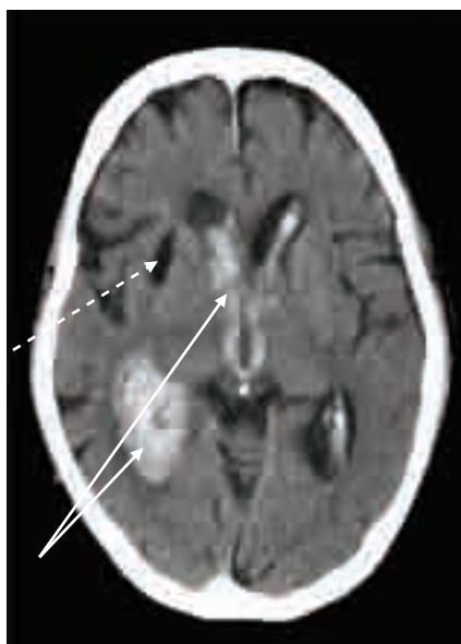
Obr. 3. Masivní intraventriculární krvácení (šipky) u warfarinizovaného pacienta (INR 4,3). Starší posthemoragická pseudocysta (přerušovaná šipka). CT vyšetření 40 min po příhodě.