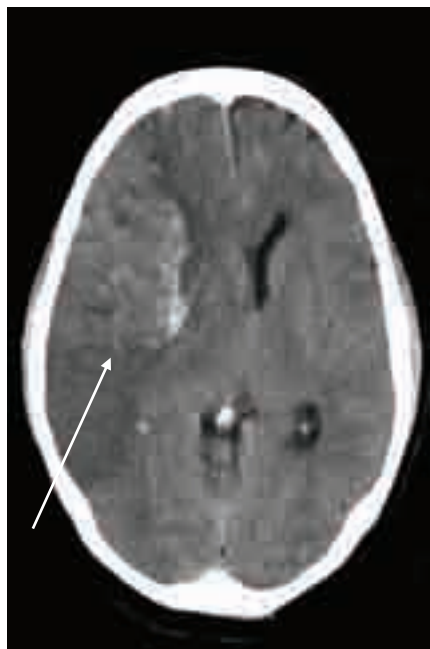
Obr. 1. Rozsáhlá expanzivně se chovající malacie v celém povodí střední mozkové tepny (šipka) s významnou hemoragickou infarzací.

Kardioembolický iktus při fibrilaci síní. Kontrolní CT 24 hod po příhodě.