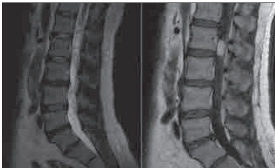
Obr. 1. MR T2WT a T1WT s kontrastem, sagitální rovina.

Přesné údaje o incidenci hemangioblastomů chybí, a to jak u tumorů ve sporadické formě, tak ve spojitosti s VHL [1]. Hemangioblastomy, svým chováním benigní nádory, tvoří asi 1,6 až 2,1 % všech míšních tumorů, z toho 21 až 28 % lokalizovaných intradurálně-extramedulárně