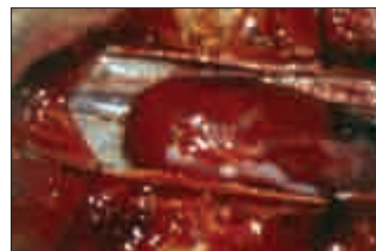
Obr. 3. Peroperační foto – tumor.