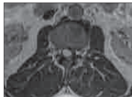
Obr. 2. MR T1WT s kontrastem, axiální rovina.

Senzitivní a v některých případech i dostatečně specifickou diagnostickou metodou je MR s podáním kontrastní látky v T1 váženém čase (obr. 1, 2). Terapeutickou možností volby je kompletní resekce nádoru, která je kurativní. Doporučována je resekce en bloc, protože intralezionální resekce vede k profuznímu krvácení i u drobných nádorů [5,11]. Proto někteří autoři doporučují předoperační selektivní spinální angiografii a embolizaci, což má nepochybně