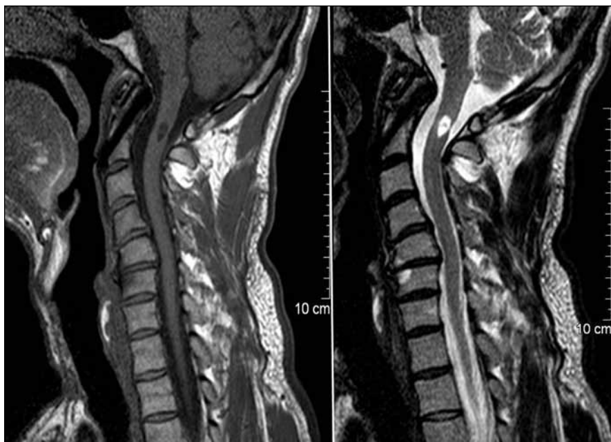
Obr. 4. MR kontrola morfologického nálezu na horní krční míše v sekvencích T1 a T2 s odstupem 6 měsíců po stabilizaci. Intramedulární pseudocysta velikosti 5 × 10 mm je výsledkem úklidové reakce uvnitř nervové tkáně. Vzhledem k výslednému neurologickému stavu pacienta jde o překvapivý nález.

Úhelným kamenem tohoto konkrétního případu bude nepochybně morfologický typ primárního poranění míchy, kdy se jednalo o čistý traumatický edém. Klinickou paralelou může být syndrom centrální šedi [3]. I v případě této nozologické jednotky je dominantním nálezem v míšním provazci edém, typicky absenteje hemoragie a mícha nebývá morfologicky desintegrovaná. Oba posledně jmenované radiologické nálezy přinášejí svému nositeli horší prognostické vy-