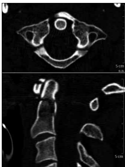
Obr. 1. CT obraz tříúlovkové zlomeniny C1 Jeffersonova typu a zlomeniny dentu C2 d'Alonzo II při příjmovém vyšetření.

туру атлантоокципитální membrány a pro-sáknutí prevertebrálních měkkých tkání. Kromě toho byly zjištěny pokročilé degenerativní změny dolní krční páteře s kyfotizací a sekundární stenózou kanálu páteřního v rozsahu C4–6, avšak bez disko-ligamentózního poranění. Mícha v této oblasti nevykazovala změny intenzity signálu.