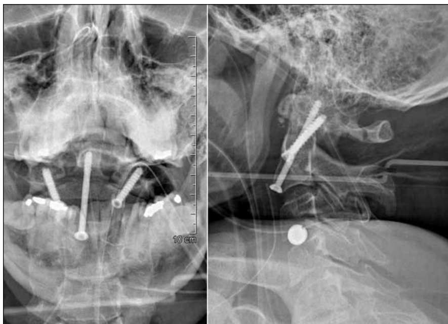
Obr. 3. Radiologická kontrola anatomického postavení a pozice implantátů po přímé osteosyntéze dentu C2 a anterolaterální transartikulární stabilizaci C2–C1.

od ramene distálně trvala ještě 15. den po úrazu. Pak již byl pacient schopen pravou ruku stisknout a flektovat loket. V téže době udržel levou dolní končetinu nad podložkou a pravostranně začínal aktivně flektovat dolní končetinu v koleni. Stav nemocného se postupně zlepšoval