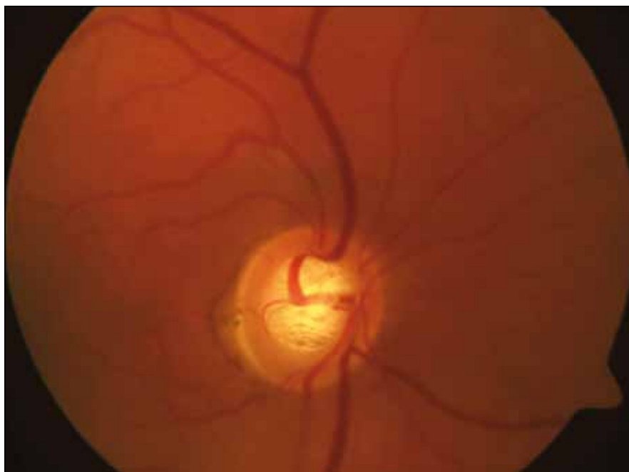
Obr. 2. Exkavace papily zrakového nervu.

V našem souboru se strabismus vyskytl v 62,50 %, resp. v 33,3 %, převlá-