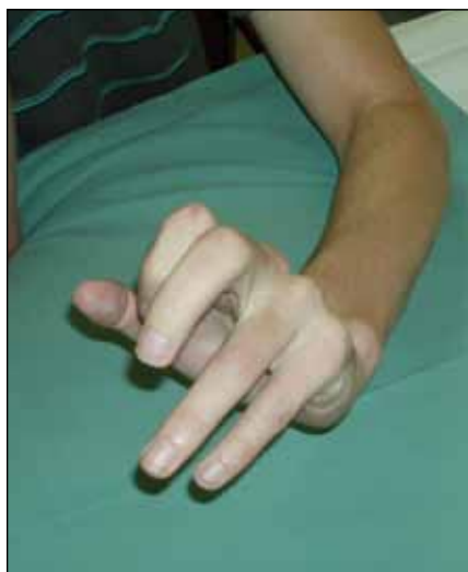
Obr. 11. Dvaadvacetiletý muž, devět měsíců po krvácení z arteriovenózní malformace s hematodem v pravém frontálním laloku. Spasticita levé ruky s flexí 1.–3. prstu a extenzí 4.–5. prstu, s extenzí v zápěstí.

Zcela nové období v léčbě cervikální dystonie začalo zařazením botulotoxinu do léčebného schématu. Botulotoxin je indikován jako lék první volby u cervikální dystonie, která je klinicky závažná – dle TWSTRS dosáhne tíže 10 a více bodů. U cervikální dystonie jsou nejčastěji postiženy mm. splenius capitis, splenius cervicis, levator scapulae, trapezius, scaleni, semispinalis capitis a sternocleidomastoideus. Před aplikací botulotoxinu do dystonických svalů je důležité provést klinický rozbor s určením svalů, do kterých se bude lék aplikovat, v jaké dávce a do kolika bodů v dystonickém svalu. K určení úrovně a distribuce dystonické ak-