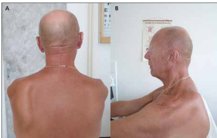
Obr. 4a) Pětašedesátiletý muž, sportovec, před 25 lety provedena operace sec. Foerster a Dandy. Pokles ramen, odstávající lopatky.

Botulotoxin se podává intramuskulárně či subkutánně v roztoku. U většiny indi-