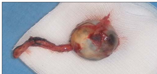
Obr. 2. Bulbus vyjmutý i se zrakovým nervem.