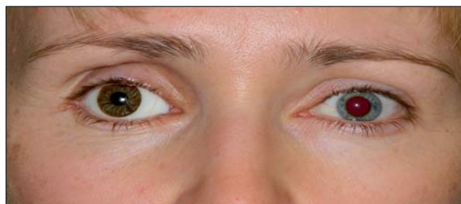
Obr. 3. Foto obličeje jeden měsíc po traumatu, vpravo je dočasná protézka.