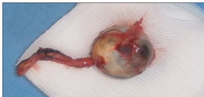
Obr. 2. Bulbus vyjmutý i se zrakovým nervem.