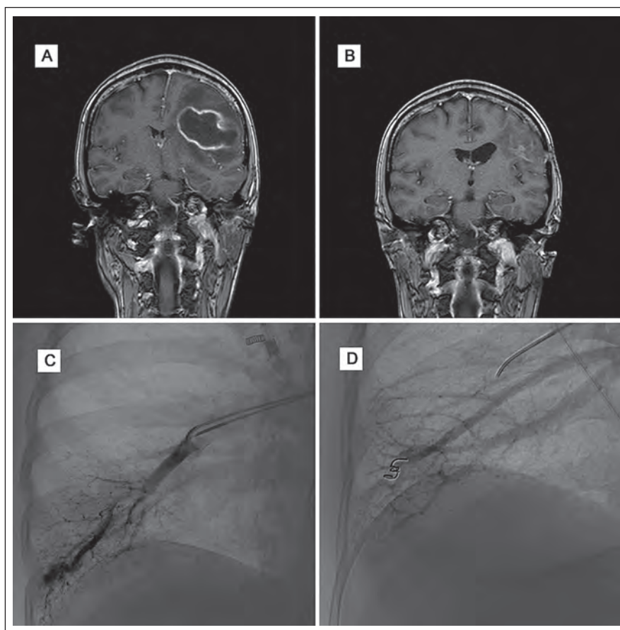
Obr. 3. Obrazová dokumentace – kazuistika 3.

Vznik HHT je asociován s různými geny a představuje geneticky heterogenní skupinu [10]. Mutace genu kódujícího ENG na chromozomu 9q33–q34.1 je odpovědná za HHT prvního typu, zatímco mutace ACVRL1 genu na chromozomu 12q11–q14 se vyskytuje u HHT druhého typu [11]. Nepřítomnost těchto mutací u dalších rodin trpících HHT vedla k identifikaci třetího typu HHT s mutací na chromozomu 5q31.3–q32 [12] a čtvrtého typu HHT s mutací na chromozomu 7p14 [13]. Kromě toho byly objeveny další mutace v oblasti MADH4/SMAD4 na chromozomu 18q21.2, které zapříčiňují vznik HHT a juvenilní polypózy [14], a v oblasti BMPRII , které zapříčiňují vznik HHT a plicní hypertenze [15]. Navíc bylo zjištěno, že vaskulární endoteliální růstový faktor (VEGF) jako signální protein podílející se na angiogenezi je zvýšen u pacientů s HHT [16]. Ovlivnění jeho exprese pak může mít vliv na fenotyp HHT. VEGF je zvýšen nejen v plazmě, ale také v nosní sliznici bez závislosti na vzniku a tíži epistaxe [17]. Závažnost klinických projevů HHT nekoreluje se žádnou specifickou mutací.