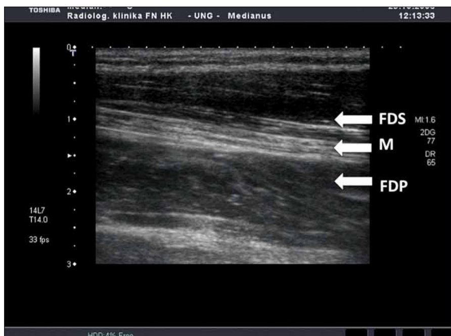
Obr. 2. Podélný řez zápěstím na předloktí (FDS – flexor digitorum superficialis, FDP – flexor digitorum profundus, M – nervus medianus).

83 let). U 34 pacientů (47 %) byla operována levá ruka a u 38 pacientů (53 %) ruka pravá. U 38 pacientů (53 %) byl výkon proveden na dominantní končetině a u 34 pacientů (47 %) na končetině nedominantní. Průměrná doba sledování po operaci byla 117 dní.