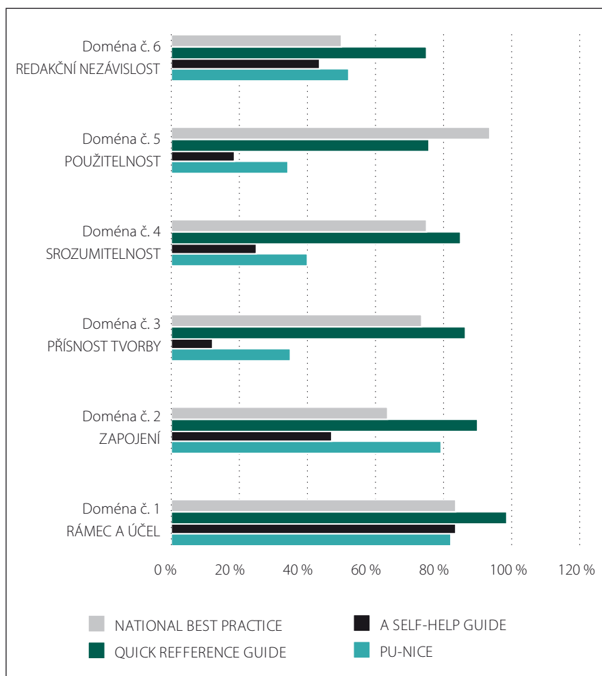
Graf 1. Celkové hodnocení v jednotlivých doménách.

NICE – zkratka pro The National Institute for Health and Care Excellence.