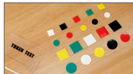
Obr. 1. Token test.

Vzhledem k nenormálnímu rozložení hodnot hrubých skóre TT a velikosti souboru jsme pro analýzu dat využili neparametrické statistické metody. Pro deskriptivní statistiku byly vypočítány průměry, mediány, standardní odchylky a rozpětí. Pomocí Kruskalova-Wallisova H-testu a chí-kvadrátu byl porovnán