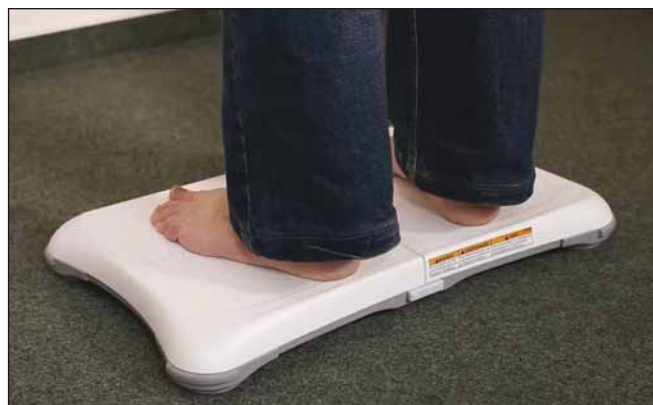
Obr. 2. Tenzometrická plošina.