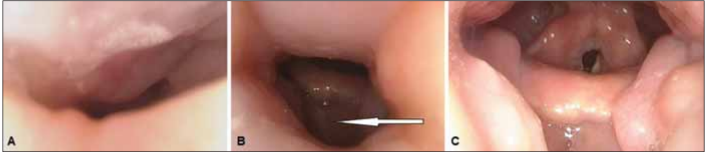
Obr. 3. Spánková endoskopie s přetlakovou ventilací, endoskopický pohled na horní dýchací cesty. (A) Předozadní obstrukce měkkého patra při tlaku 0 hPa; (B) stav horních dýchacích cest při tlaku 12 hPa – částečná obstrukce v oblasti měkkého patra a orofaryngu, přetrvávání úplné obstrukce kořene jazyka s útlakem epiglottis (šipka); (C) horní dýchací cesty volné ve všech etážích při tlaku 18 hPa.

Fig. 3. Drug-induced sleep endoscopy with positive airway pressure; endoscopic view of the upper airways. (A) Anteroposterior obstruction of the soft palate at a pressure of 0 hPa; (B) posture of the upper airways at a pressure of 12 hPa – partial obstruction in the area of the soft palate and oropharynx, and persistence of complete obstruction of the root of the tongue with the oppression of the epiglottis (arrow); (C) upper airways without obstruction in all sites at a pressure of 18 hPa.