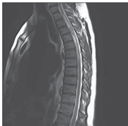
Obr. 1. MR hrudní a krční páteře, T2-vážený obraz, sagitální projekce. Hypersignální intramedulární ložisko v úrovni třetího a čtvrtého hrudního obratle s výrazným edémem míchy.

Fig. 1. MRI of cervical and thoracic spine, T2-weighted image sagittal projection. Hyperintense intramedullary lesion at the level of the third and the fourth thoracic vertebra with significant spinal cord edema.