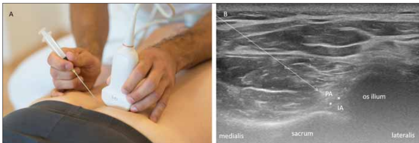
Obr. 4. Ultrasonograficky navigovaný léčebný obstřik sakroilického kloubu technikou direct in-plane. (A) Pronační poloha pacienta na vyšetřovacím lehátku, směr inzerce jehly je mediolaterální; (B) část léčebné směsi je aplikována intraartikulárně (IA) a část periartikulárně (PA).

Bílé hvězdičky, ligg. sacroiliaca dorsalia; bílá přerušovaná šipka, trajektorie jehly.