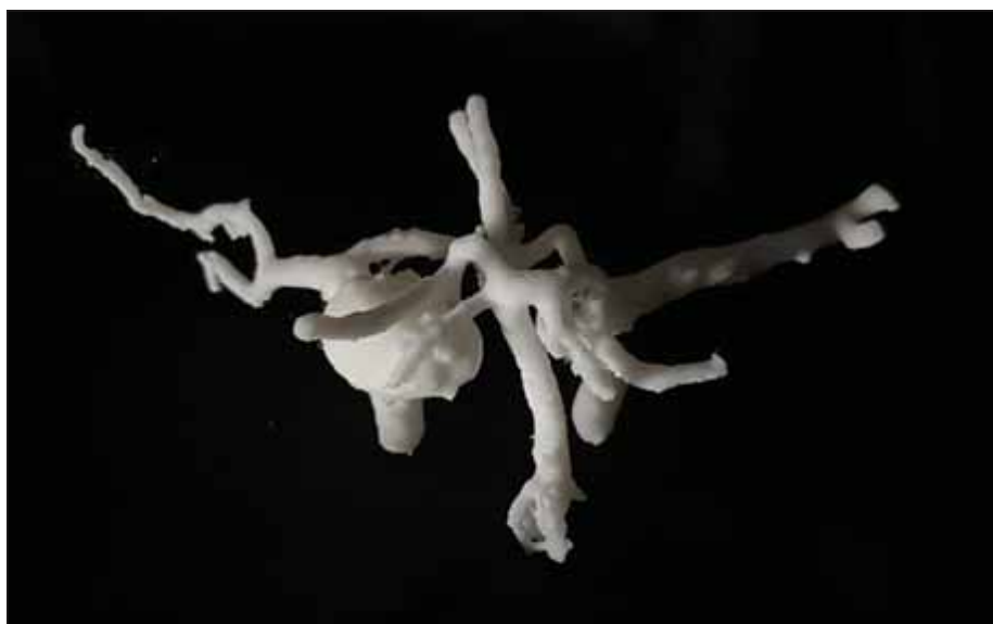
Obr. 1. 3D model aneuryzmatu ve větvení střední mozkové tepny.

DSA – digitální subtrakční angiografie; M – muž; Ž – žena