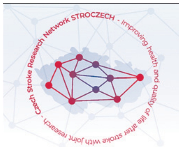
Obr. 3. Mikulenkova P et al.

Podpořeno sítí STROCZECH v rámci výzkumné infrastruktury CZECRIN (č. projektu LM2023049), financované státním rozpočtem České republiky.