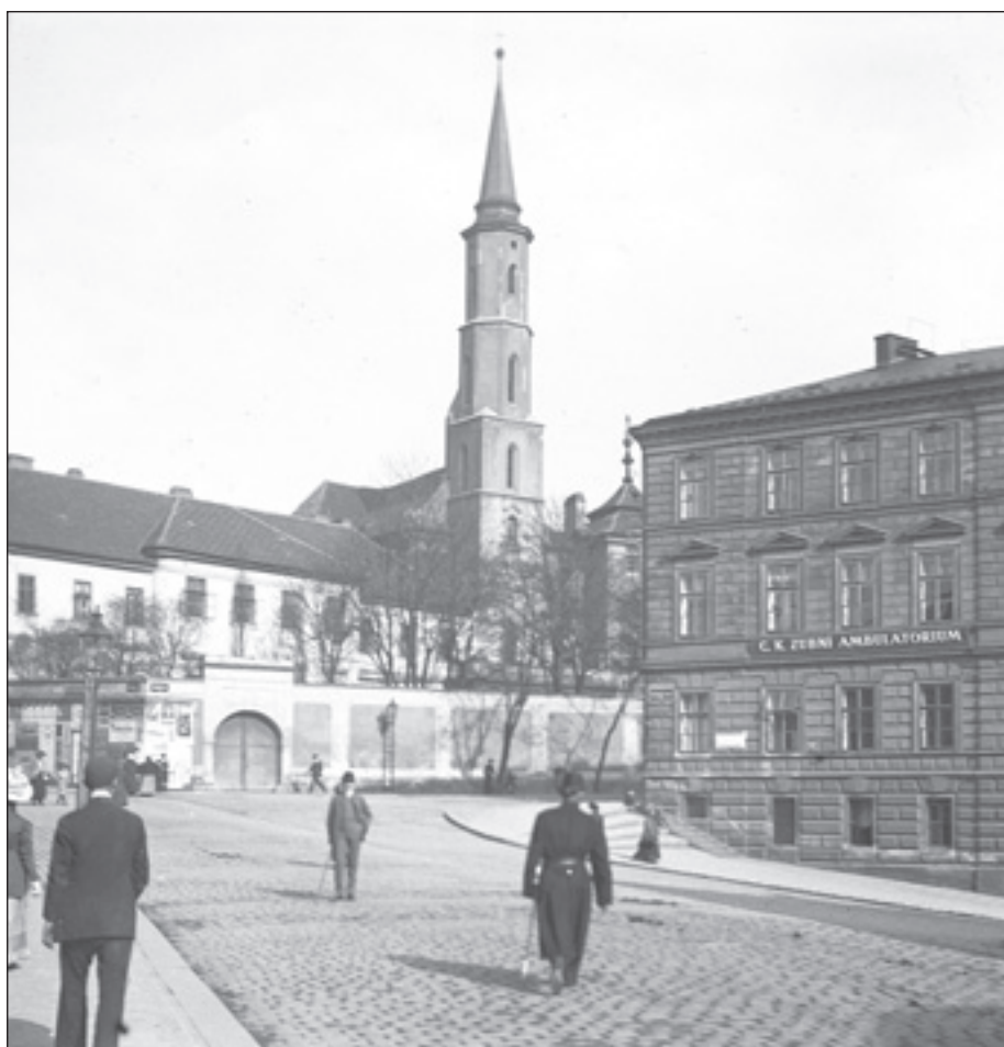
Obr. 5. Fotografie budovy ve Viničné ulici č. 9 (C. K. zubní ambulatorium), kláštera a kostela sv. Kateřiny v Kateřinské 30 z přelomu 19. a 20. století. Publikováno se souhlasem Muzea hlavního města Prahy (inv. č. HNN 007 100).

Fig. 5. Photograph of the building at Viničná Street No. 9 (Imperial-Royal Dental Outpatient Clinic), and the monastery and church of St. Catherine at Kateřinská 30 from the turn of the 19 th and 20 th centuries. Published with the permission of the Museum of the City of Prague (inv. no. HNN 007 100).