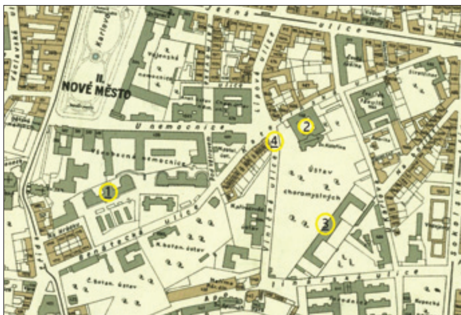
Obr. 4. Mapa Všeobecné nemocnice a okolí – stav z roku 1938: 1. Tzv. Jubilejní pavilon, kde byla umístěna neurologická část do roku 1944; 2. „Kateřinky“ neboli „Starý dům“ – do roku 1942 Zemský ústav choromyslných, od roku 1944 sídlo neurologické části německé Psychiatricko-neurologické kliniky; 3. „Nový dům“ sídlo psychiatrické části německé Psychiatricko-neurologické kliniky; 4. budova ve Viničné ulici č. 9, od roku 1943 české neurologické oddělení Všeobecné nemocnice.