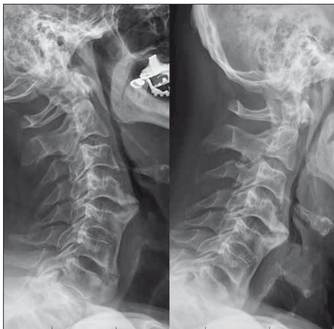
Obr. 7. Předoperační funkční RTG (kazuistika 2).

Fig. 6. Preoperative MRI, sagittal image (a case report 2).