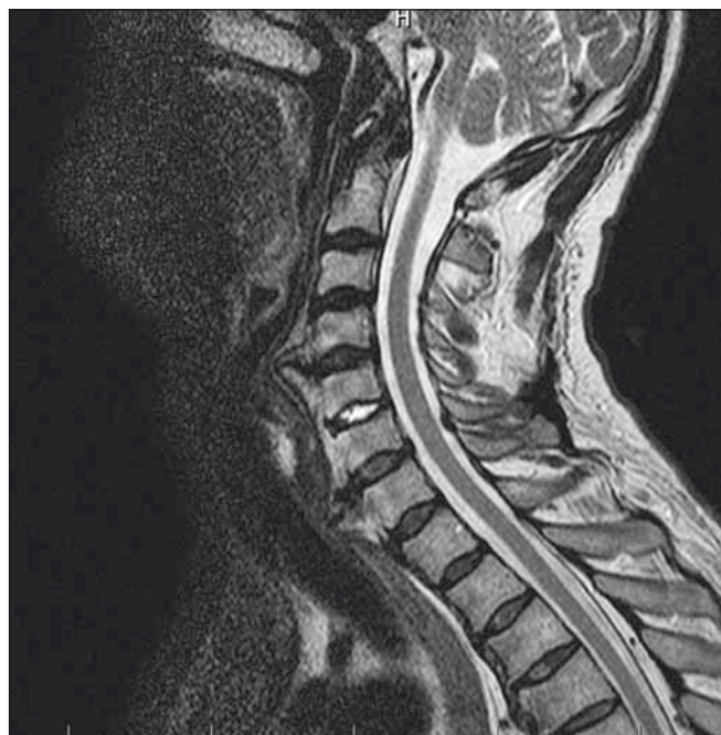
Obr. 6. Předoperační MR, sagitální snímek (kazuistika 2).

Fig. 5. Follow-up X-ray after six months (a case report 1).