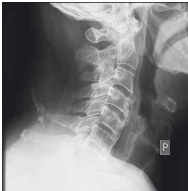
Obr. 5. Kontrolní RTG po šesti měsících (kazuistika 1).

Fig. 5. Follow-up X-ray after six months (a case report 1).