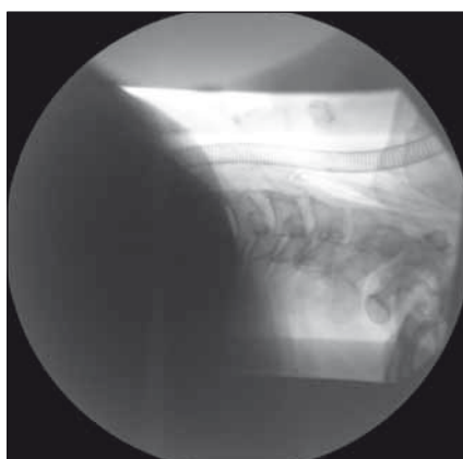
Obr. 4. Peroperační RTG po snesení předních osteofytů (kazuistika 1). Fig. 4. Intraoperative X-ray after the ablation of front osteophytes (a case report 1).

intervertebrálních kloubů a sakroiliakálního skloubení.