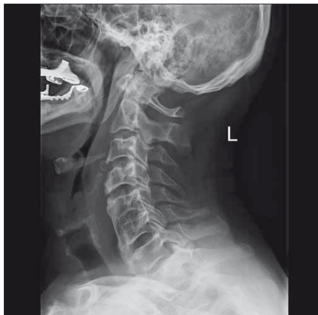
Obr. 8. Pooperační RTG po snesení předních osteofytů (kazuistika 2).

Fig. 7. Preoperative functional X-ray (a case report 2).