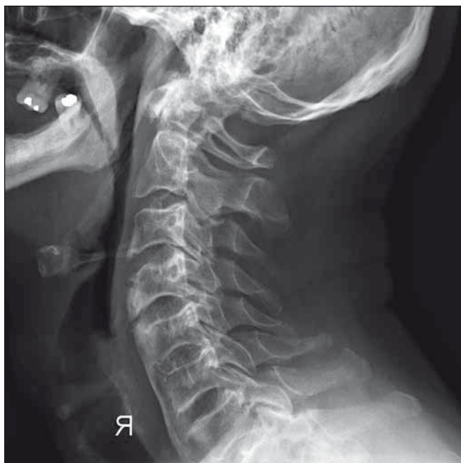
Obr. 9. Kontrolní RTG po šesti měsících (kazuistika 2).

Fig. 9. Follow-up X-ray after six months (a case report 2).